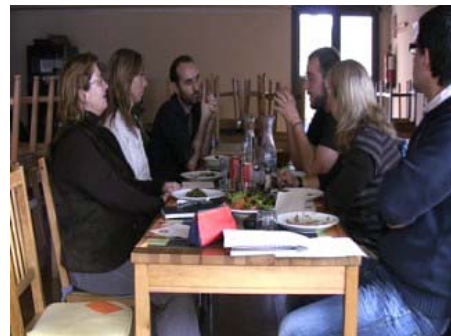
Foto 1: Focus Grup de evaluación de actividades de Educación para la Sostenibilidad.

Para la evaluación, se realizó un focus grup para cada actividad seleccionada con un total de cinco encuentros. El escenario fue esta vez el Centro Cultural Terra Dolça de Sant Cugat del Vallès, con la novedad de que estos focus grup se realizaron durante un almuerzo, ya que se consideró esa hora el momento con más facilidad para encontrarse. (Foto 1).