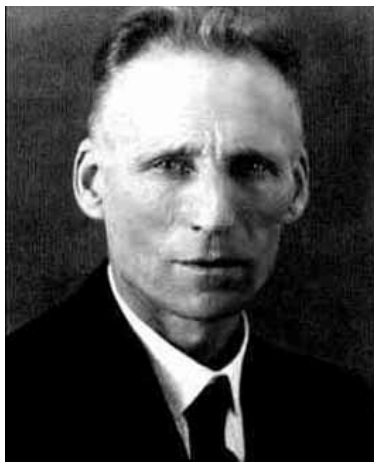
Luitzen E. J. Brouwer

No cabe ninguna duda de que un avance definitivo hacia la formalización del concepto del llamado grado de Brouwer lo dieron Hadamard en 1910 ([18]) y el mismo Brouwer (1881-1966) en sus artículos de 1910, 1911 y 1912 ([8], [9], [10]) pero tampoco cabe ninguna duda de que herramientas matemáticas similares habían sido introducidas con anterioridad, como la llamada “integral de Kronecker” ([24]) relacionada con la fórmula (21) (que incluso había sido ya considerada por Cauchy en dimensión n = 2 ) o el concepto de “rotación de un campo vectorial” introducido por Poincaré en su estudio de sistemas autónomos de ecuaciones diferenciales ordinarias de primer orden.