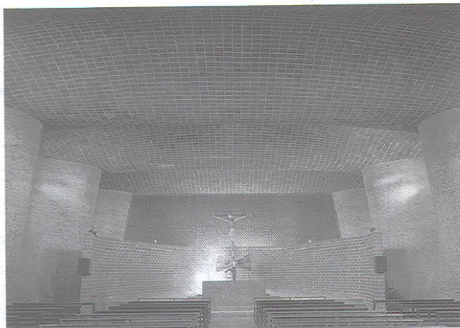
IGLESIA DE ATLÁNTIDA (MONTEVIDEO), OBRA DE ELADIO DIESTE.

Tras ser presentada en Montevideo (Uruguay) el 21 de noviembre de 1996 y en Sevilla el 24 de abril de 1997, la exposición autoportante tiene pre-