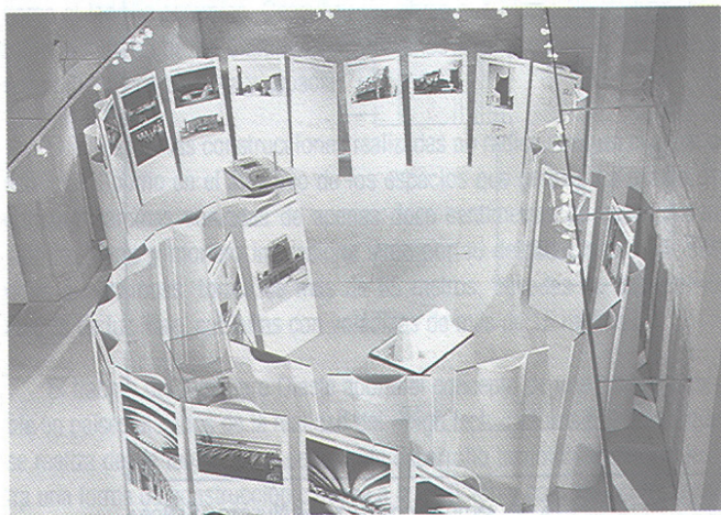
MONTAJE DE LA EXPOSICIÓN EN SEVILLA.

La sala de exposiciones de la Intendencia de Montevideo, ubicada en la Avda. 18 de Julio de la capital uruguaya y recientemente reformada, fue inaugurada con la exposición Dieste. Ubicada en una planta sótano con iluminación cenital a través de un gran lucernario, la sala está localizada