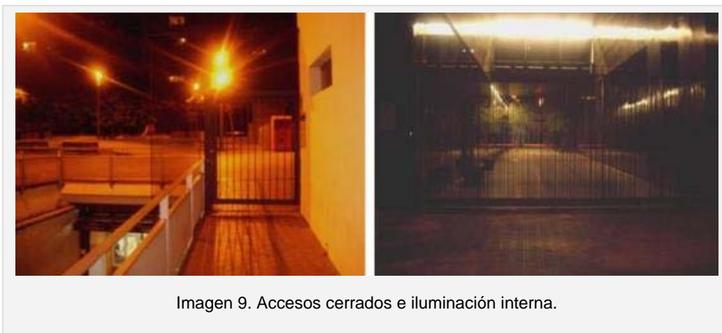
Imagen 9. Accesos cerrados e iluminación interna.

El poder municipal no oculta sus estrategias a través del proyecto, define un “urbanismo preventivo” para “promover el buen uso del espacio y evitar conductas delictivas a través de las actuaciones de tipo arquitectónico” (3). En este concepto se incluyen tácticas como el cierre de los jardines por la noche, uso