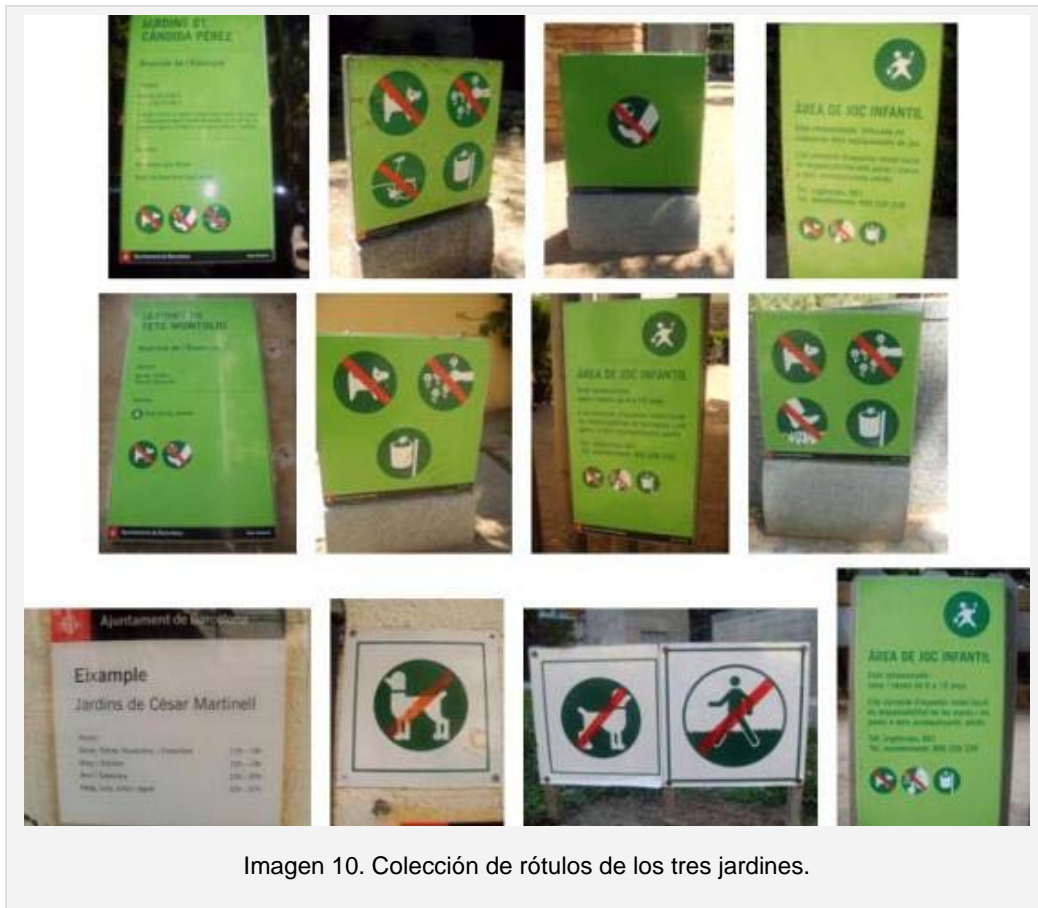
Imagen 10. Colección de rótulos de los tres jardines.