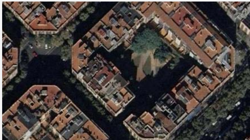
Imagen 4. Emplazamiento a vista de pájaro del jardín Cèsar Martinell.

Los jardines de Cèsar Martinell están ubicados en el interior de la manzana que delimitan las calles Villarroel, Diputació, Casanova y la Gran Vía de les Corts Catalanes, y aunque muy cerca de Tete Montoliu, el barrio es otro: la Antiga Esquerra de l'Eixample. Posee dos accesos muy diferenciados pero que convergen en una misma esquina del jardín: uno es del tipo “fisura” por la calle Villarroel y el otro es de tipo “puerta” por la Gran Vía. El acceso fisura, en los primeros años del jardín, fue el único que existía y comparte espacio con la rampa del garage subterráneo que se construyó bajo los jardines. Años más tarde al edificarse el hotel Soho se habilitó el segundo acceso desde la Gran Vía de forma integrándose en el diseño del nuevo edificio como un largo y amplio pasillo en su planta baja. La superficie del jardín es de 2582 m 2 .