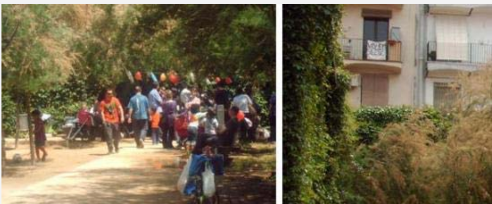
Imagen 11. Apropiación festiva un domingo y pancarta reivindicativa en el jardín Càndida Pérez.

La distancia entre los jardines “vividos” y los jardines “concebidos” crece notablemente cuando la gente usa el espacio público respondiendo a intereses propios, negociando mediante el conflicto, el acuerdo o la permisividad del resto de la gente, a expensas de lo que las instancias políticas o económicas puedan dictaminar. Tal es el caso de los usuarios que pasean sus perros incumpliendo lo que ordenan los rótulos y enfrentándose a otros vecinos, las familias que organizan fiestas de cumpleaños de niños con su caterva de invitados, la práctica informal de deportes como fútbol o bádminton, y los adolescentes y vagabundos que buscan algo de intimidad cada uno según sus intereses particulares y enfrentándose al control policial de forma diferente.