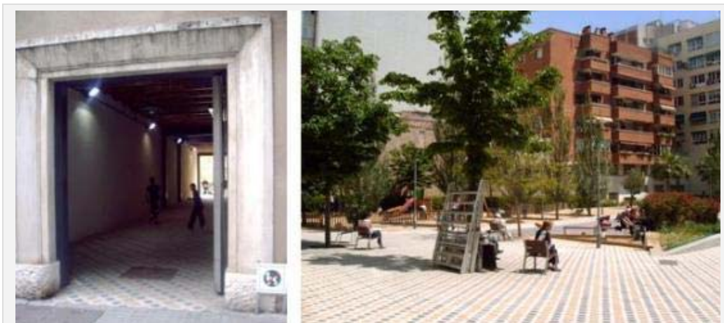
Imagen 2. Acceso tipo "pasillo" e interior del jardín Tete Montoliu.

Desde una perspectiva de la experiencia del entorno arquitectónico los jardines en interiores de manzana producen nuevos acontecimientos en el paisaje de l'Eixample. Las fachadas de los edificios que dan al interior siempre se consideraron y se diseñaron como "fachadas traseras" sin valor estético, por lo cual están menos elaboradas proyectualmente que las fachadas visibles desde las calles. La posibilidad de acceso a los interiores de las manzanas convierten estas fachadas secundarias e invisibles en fachadas de primer orden.