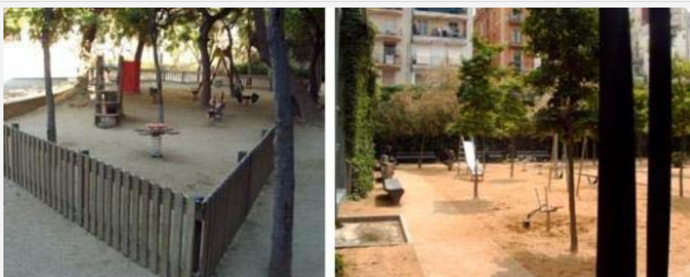
Imagen 8. Área de juegos infantiles valladas y sin vallar.

Bajo esta mirada como equipamiento público los tres jardines poseen un indisimulado objetivo: ofrecer unos territorios en el interior de la ciudad que imiten a los “espacios naturales”. El predominio de lo “verde”, a base de árboles, arbustos y plantas trepadoras así como las áreas de pavimentos de tierra, intenta emular lo natural. Los suelos duros típicos de lo urbanizado solo aparecen cuando es estrictamente necesario. La naturaleza queda humanizada y categorizada en la terminología urbanística como “verde urbano”, concepto que se quiere asociar a la mejora de la “calidad de vida” en la ciudad.