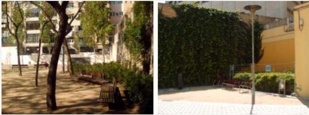
Imagen 7. El verde urbano de los jardines: arbolado, arbustos y enredaderas.