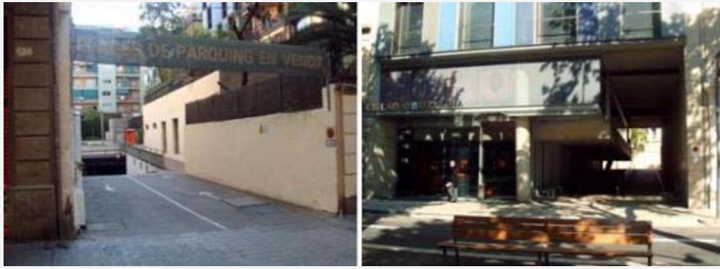
Imagen 3. Accesos tipo “fisura” con rampa de aparcamiento y “puerta” bajo el hotel en Cèsar Martinell.

Los jardines de Cèsar Martinell están ubicados en el interior de la manzana que delimitan las calles Villarroel, Diputació, Casanova y la Gran Vía de les Corts Catalanes, y aunque muy cerca de Tete Montoliu, el barrio es otro: la Antiga Esquerra de l'Eixample. Posee dos accesos muy diferenciados pero que convergen en una misma esquina del jardín: uno es del tipo “fisura” por la calle Villarroel y el otro es de tipo “puerta” por la Gran Vía. El acceso fisura, en los primeros años del jardín, fue el único que existía y comparte espacio con la rampa del garage subterráneo que se construyó bajo los jardines. Años más tarde al edificarse el hotel Soho se habilitó el segundo acceso desde la Gran Vía de forma integrándose en el diseño del nuevo edificio como un largo y amplio pasillo en su planta baja. La superficie del jardín es de 2582 m 2 .