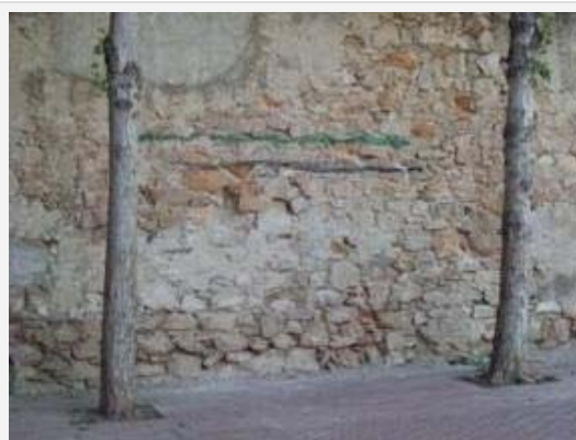
Imagen 12. Portería virtual para jugar a fútbol en el jardín Cèsar Martinell.

El espacio público también es utilizado como lugar de trabajo. En los jardines etnografiados se dan múltiples formatos que tienen que ver con “ganarse la vida” en lo que podríamos representar como un continuo que va desde el extremo del empleo formal de los trabajadores que están al cuidado del espacio público, pasando por personas que cuidan niños o ancianos, hasta al extremo de lo ilegal como la venta de drogas o la sustracción de ropa usada de los contenedores .