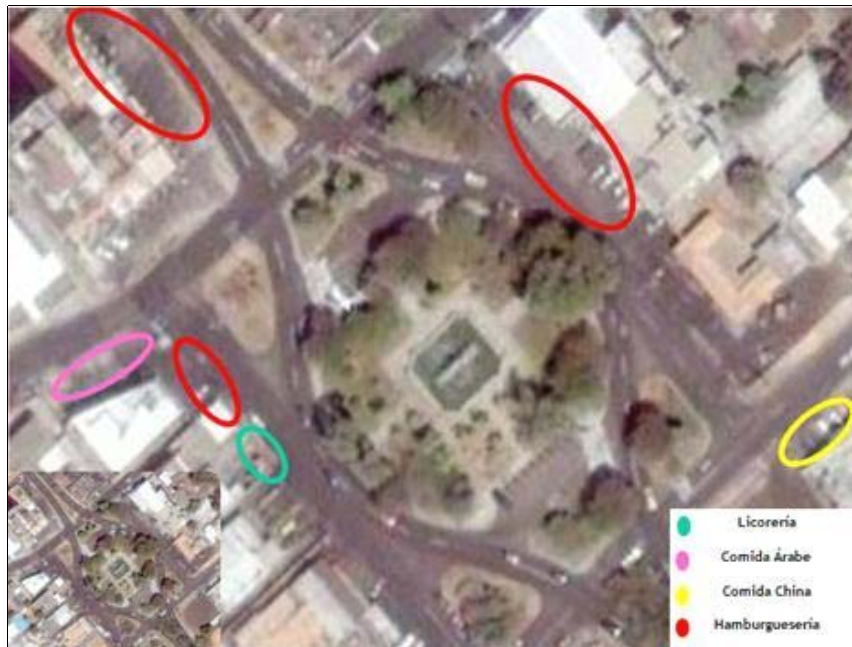
Figura 1. Localización de los establecimientos gastronómicos en los alrededores de la plaza Indio Mara.