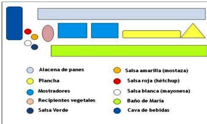
Figura 3. Micro-espacio interno típico del "carrito" de los puestos de hamburgueserías de la plaza Indio Mara.