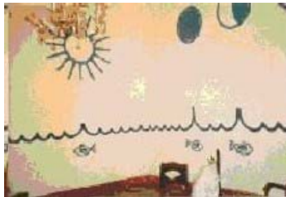
Interior de una casa-templo a Yemayá, en Trinidad.

En algunos casos, el lugar donde el culto los orichas no es ya una habitación reservada en la casa de cada santero sino auténticas casas-templo dedicadas a la advocación de algún oricha en concreto y regentadas por el correspondiente cabildo de una localidad. En Trinidad tuve ocasión de ver una dedicada a Yemayá (la divinidad marítima).