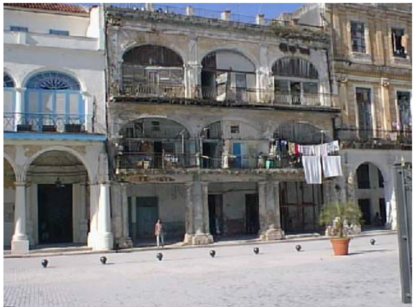
Estado actual de San Ignacio 360.

En el barrio de San Isidro, puede entrevistarse a tres vecinos (5) de la ciudadela de Paula 205, donde coexistían varios vecinos santeros, junto con un babalawo y algún convencido de la Revolución en un sentido más ortodoxo que los anteriores. Estas entrevistas también se grabaron en vídeo.