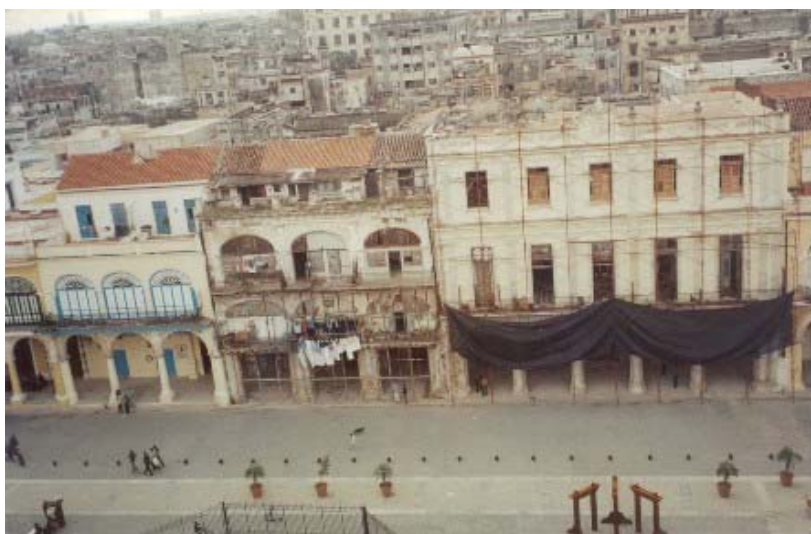
Vista general de los tres inmuebles estudiados en la Plaza Vieja.

Con respecto a la denominación de solares , cuarterías o ciudadelas , sospecho que en ella se pueden dar elementos tanto objetivos como subjetivos; es decir, tras preguntar a varios informantes (algunos de ellos, eminentes intelectuales de la ciudad) me pareció percibir que la denominación que hace más referencia a los aspectos menos valorados socialmente de estos edificios es la de solar; aunque la de cuartería también se refería a edificios poco valorados, generalmente construidos en solares (7) que al dividirse por la mitad habían dado lugar a "cuartos" en torno a un patio lateral, los cuales eran alquilados a familias, parece ser que con algo más de garantías de habitabilidad que los solares .