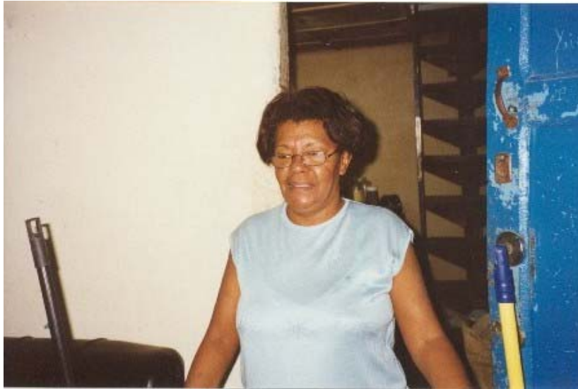
Una de mis informantes.

En la primera zona mencionada realicé entrevistas en tres de sus circunstancias especialmente cruciales para los mismos, lo que me permitió obtener información muy relevante, aunque dolorosa para algunos de los inmuebles, con la "suerte" de acudir a ellos (sobre todo uno) en vecinos. En efecto, en la casa del Conde Cañongo (San Ignacio 362-364). Estaban a punto de ser desahuciados las dos últimas familias -emparentadas-, como así ocurrió el día 7 de enero de 2004, apenas dos días después de lo que les habían dicho, puede ser que para respetar su presencia en sus domicilios el día de Reyes una fecha tan importante aún hoy para la ciudad de La Habana y día en que los "cabildos de negros" realizaban algunas de sus más importantes celebraciones y parece que aún hoy lo hacen. Con este desahucio tomé conciencia del trauma que sufre los barrios periféricos (Alamar, etc.). Trauma que tiene algo de sentimental, pero también de sentido práctico, porque se les aleja así de los lugares donde abunda más el dólar con la posibilidad de tener una vida más holgada. También realicé dos entrevistas (una de ella en vídeo) en la misma Plaza Vieja (3), en San Ignacio 360-358 y otra dos, también grabadas en vídeo (4), en San Ignacio 356-354, donde además de vecinos está la Dirección de Arquitectura de la Oficina del Historiador de la Ciudad.