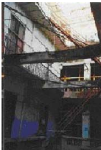
Estado actual de San Ignacio 360 (Plaza Vieja).

Es difícil interpretar esta diferencia, pero quizás la explicación podría ir en la dirección de un menor asentamiento en el tiempo para las ciudadelas habaneras, lo que no habrá posibilitado que hayan sido incluidas, con la misma intensidad, en la mitología popular (lo que parece reflejar el otorgamiento de nombres). También pudiera ser que esta ocasión mis informantes fueron arquitectos, los cuales no suelen darle importancia a estos aspectos de la cultura popular.