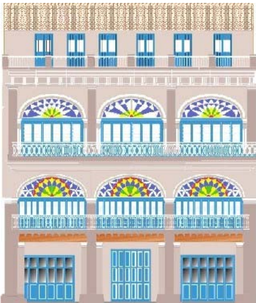
Proyecto de fachada de San Ignacio 360.

En la primera zona mencionada realicé entrevistas en tres de sus circunstancias especialmente cruciales para los mismos, lo que me permitió obtener información muy relevante, aunque dolorosa para algunos de los inmuebles, con la "suerte" de acudir a ellos (sobre todo uno) en vecinos. En efecto, en la casa del Conde Cañongo (San Ignacio 362-364). Estaban a punto de ser desahuciados las dos últimas familias -emparentadas-, como así ocurrió el día 7 de enero de 2004, apenas dos días después de lo que les habían dicho, puede ser que para respetar su presencia en sus domicilios el día de Reyes una fecha tan importante aún hoy para la ciudad de La Habana y día en que los "cabildos de negros" realizaban algunas de sus más importantes celebraciones y parece que aún hoy lo hacen. Con este desahucio tomé conciencia del trauma que sufre los barrios periféricos (Alamar, etc.). Trauma que tiene algo de sentimental, pero también de sentido práctico, porque se les aleja así de los lugares donde abunda más el dólar con la posibilidad de tener una vida más holgada. También realicé dos entrevistas (una de ella en vídeo) en la misma Plaza Vieja (3), en San Ignacio 360-358 y otra dos, también grabadas en vídeo (4), en San Ignacio 356-354, donde además de vecinos está la Dirección de Arquitectura de la Oficina del Historiador de la Ciudad.