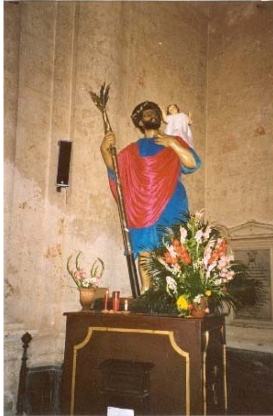
Imagen de San Cristóbal que se conserva en la catedral de La Habana.

Pero centré mi trabajo en lo que había sido La Habana colonial, en la llamada ciudad intramuros, protegida por los cuatro castillos de Los Tres Reyes Magos del Morro, La Cabaña, La Punta y la Real Fuerza, y guardada por ellos de los ataques corsarios, que actuaban bien por su cuenta o bien por cuenta de otras potencias. En este entorno, más asequible físicamente para el investigador, y también más influido por los patrones culturales hispanos, desde el punto de vista arquitectónico (y por lo tanto más comparables con los edificios que ya había estudiado en Sevilla), tuve ocasión de encontrar numerosas muestras de ciudadelas que habían llegado a tales, curiosamente no ya durante de la colonia española sino posteriormente, cuando la Revolución le permite a muchos cubanos que habían llegado a La Habana con el ejército libertador, el 6 de enero de 1959, ocupar colectivamente edificios ocupados por un solo dueño o por pocas personas. En efecto, se produce una colectivización de la propiedad por esta época y, con ella, de la propiedad de la vivienda, que pasa a ser del Estado, el cual distribuye las viviendas de manera igualitaria entre todos los que la necesitaban, que son muchos recién llegados a La Habana con la esperanza de una vida mejor, libre de las miserias que anteriormente habían padecido y con el deseo de hacer realidad algo tan simbólico como era el poder residir en la capital que anteriormente había sido el baluarte de la tiranía de Batista.