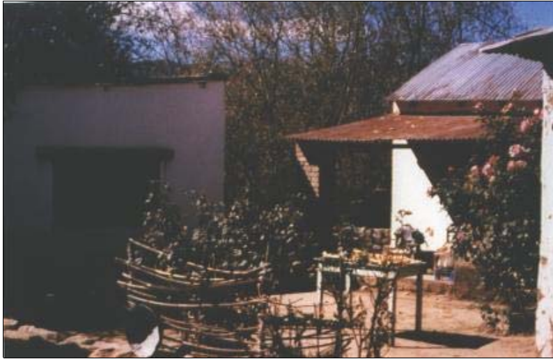
Figura 4. Vista del patio de la casa Bohorquez Mamaní, La Ovejería.