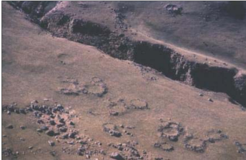
Figura 1. Unidades domésticas prehispánicas.