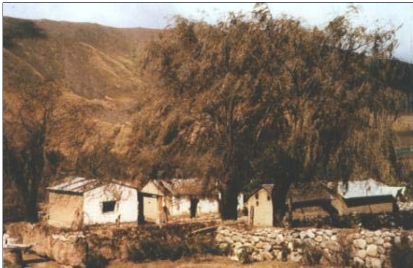
Figura 2. Vista general conjunto vivienda Florencio Mamani, Santa Cruz.