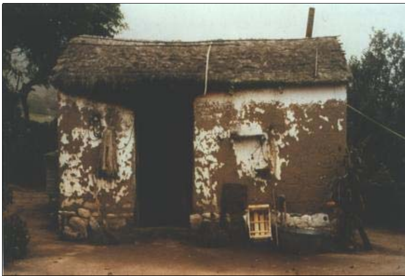
Figura 5. Vista fogón casa Gerarda Chavarría de Mamaní, El Rincón.