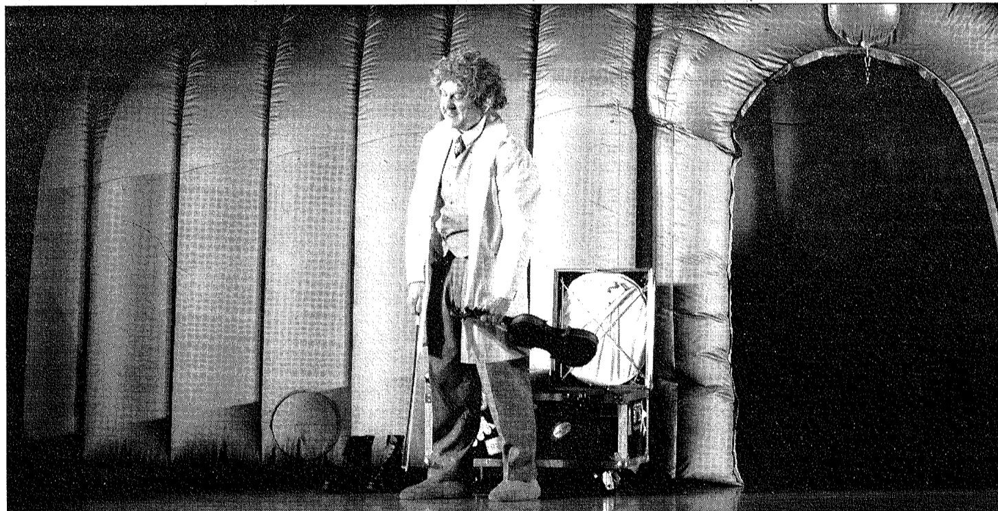
REPRESENTACIÓN. El intérprete de "Einstein" se dirige a los más de cuatrocientos escolares que asistieron a la puesta en escena.

La Fundación Caja Rural acerca a los escolares el ingenio de Einstein