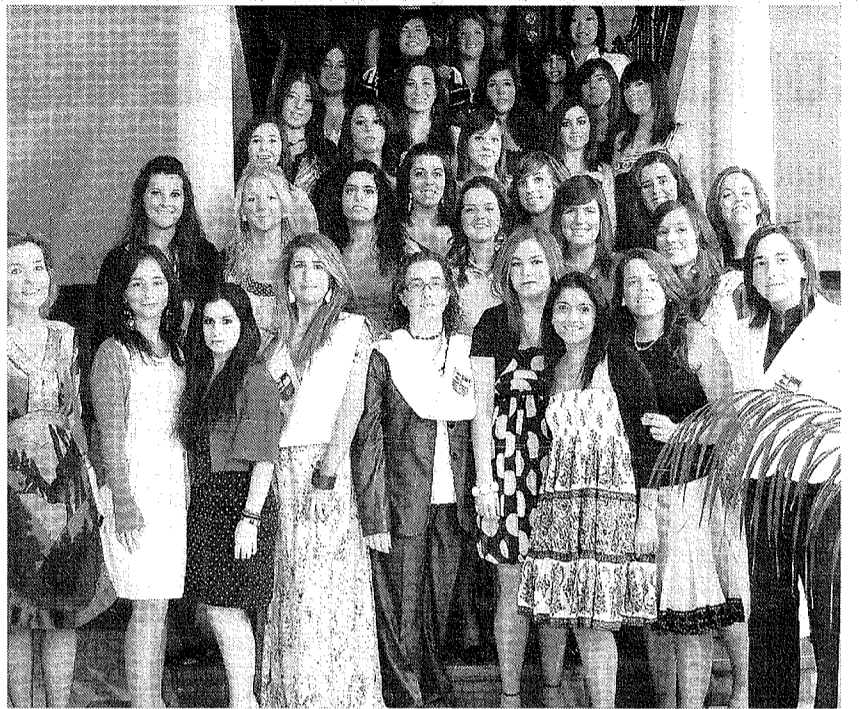
ALSAJARA. Imposición de becas en el Colegio Mayor.

Es una asignatura que asusta, incluso oírla. Pero nada más lejos de la realidad. Las Matemáticas son asombrosas, interesantes y muy útiles. Y si no que se lo pregunten a los chicos y chicas procedentes de diferentes puntos de Andalucía, que ayer se reunieron en el salón de actos del instituto Padre Manjón. Jóvenes, entre 12 y 14 años, que han participado en el proyecto Estalmat Andalucía, una iniciativa impulsada por la Real Academia de Ciencias de Madrid y por la Sociedad Andaluza de Educación Matemática Thales, que ayer clausuró su curso 2007-2009 en Granada. Con el fin de preparar desde épocas tempranas buenos profesionales para el ámbito de la ciencia y la investigación, nació esta iniciativa que, además, cuenta con el apoyo de la Fundación Vodafone, de la Obra Social de Cajazol, de las consejerías de Innovación, Ciencia y Empresa y Educación de Andalucía, y del