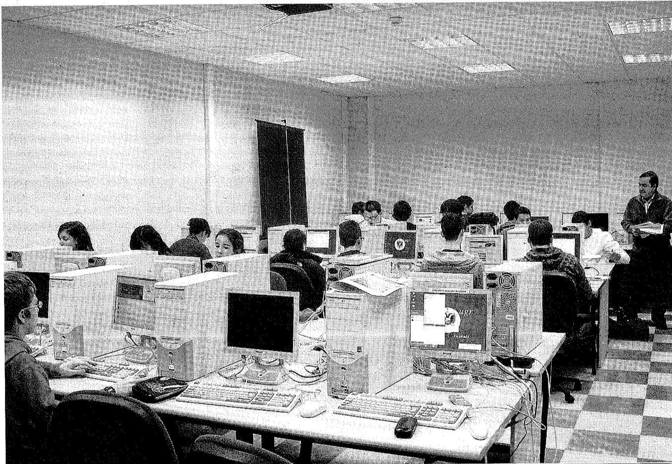
Aprendizaje. Alumnos de segundo curso en clase de informática.

En primer lugar se lleva a cabo un proceso de selección basado en el desarrollo de una prueba escrita y en una entrevista personal. La primera prueba está orientada a identificar aquellos alumnos de entre 12 y 14 años que demuestren cierta genialidad