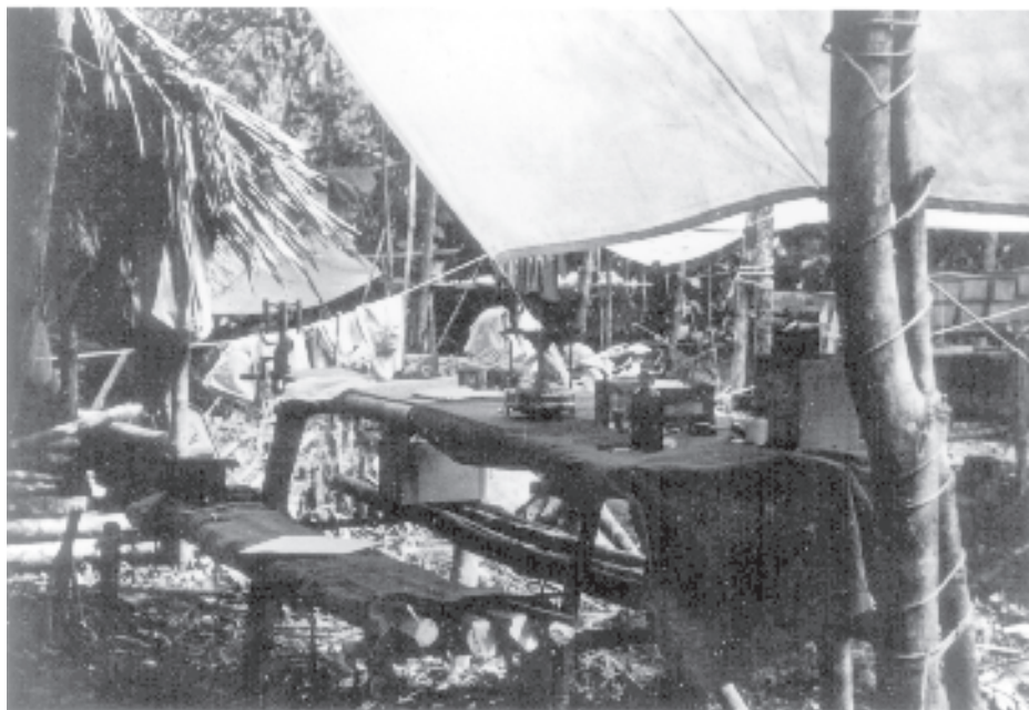
Figura 1.—Mesa de trabajo en un sitio de investigación de fiebre amarilla selvática. Nótese la centrífuga de mano y la estufa/esterilizador primus. Colombia, alrededor de 1935.

el país, todos ellos factores que el gobierno no estaba dispuesto a asumir (27).