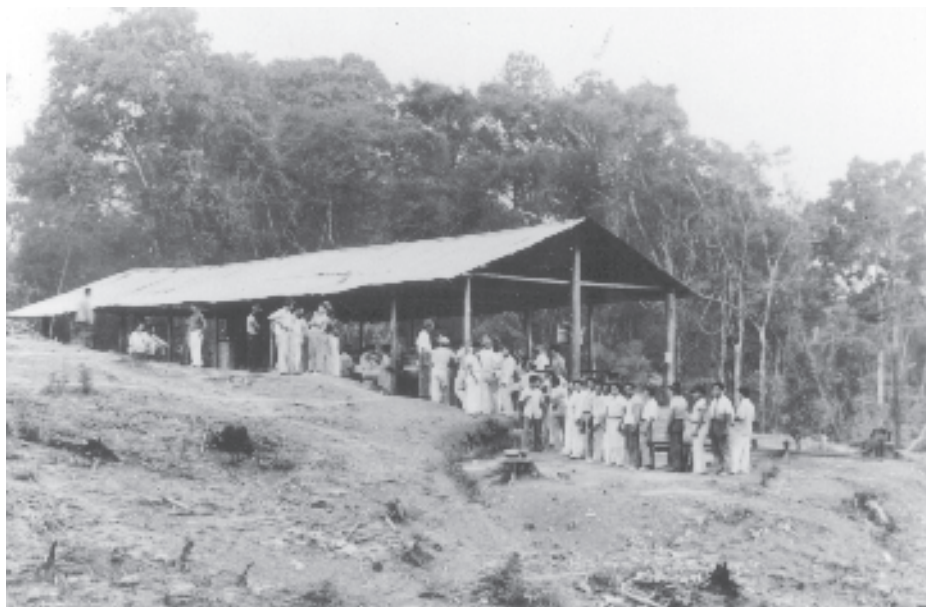
Figura 3.—Colombia rural, 1939. Grupo esperando ser inmunizado contra la fiebre amarilla.

abordados por prestigiosos médicos y políticos solicitando apoyo para este proyecto, pero este apoyo nunca fue contemplado seriamente. El gobierno colombiano también pidió repetidamente a la Fundación que se involucrara en el estudio de la bartonelosis, cuya presencia se encontró en el sur del país y constituía un problema importante de salud pública en esta región, pero las instrucciones de Sawyer eran claras: limitar el trabajo a fiebre amarilla (61).