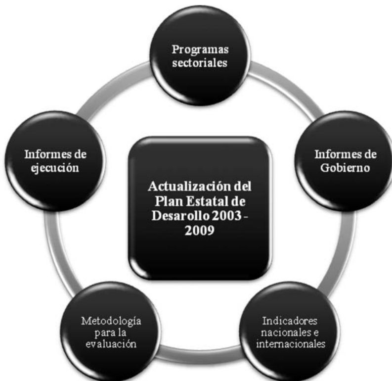
Figura 1. Insumos básicos para la actualización del PED