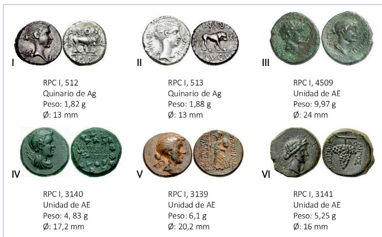
Lám. 1. Monedas donde Fulvia es representada.

En el caso de las monedas donde Fulvia es representada, nos encontramos con leyendas en latín y griego. Las dos primeras monedas son quinarios de plata del 43 y 42 a. C., respectivamente (Lám. 1). La primera de ellas cuenta con leyenda únicamente en el reverso y hace alusión a la ceca donde se acuñó dicha moneda: LVGV+DVNI equivale a Luguduni relacionándose con Lugdunum . La letra A equivale a annos (años) y XL a 40 (WOODS 2019: 252). Diversos autores señalan que se trataría de la edad de Marco Antonio al momento de la acuñación. La tercera pieza se presenta como la única donde Marco Antonio y Fulvia aparecen juntos; él en el anverso y ella en el reverso. Es considerada como una moneda extremadamente rara y se trata de un as de bronce. La leyenda en griego «ΤΡΙΠΟΛΙΤΩΝ ΛΓΚ» que aparece en el reverso señala la ceca donde se acuñó dicha moneda concretamente en Trípoli, Fenicia, en la provincia de Siria. Las otras tres monedas son producidas en una misma ceca situada en la ciudad de Eumeneia en Frigia. La leyenda «ΦΟΥΛΟΥΙΑΝΩΝ» hace referencia al cambio de nombre de la ciudad pasando de conocerse como Eumeneia a llamarse Fulvianum en honor a Fulvia. Esta sería la única referencia escrita conocida sobre Fulvia en el soporte de la moneda.