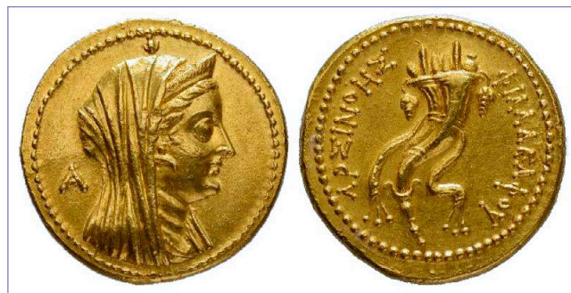
Fig. 2. Octodracma con representación de Arsínoe II en el anverso (Svoronos 419).

En el caso helenístico y con la introducción de la moneda en Egipto, tenemos a Arsínoe II como la primera mujer immortalizada en este soporte en el siglo III a. C. (Fig. 2). Para las acuñaciones romanas habría que esperar un poco más; Fulvia y Octavia comparten el privilegio de ser las primeras en representarse como mortales en la moneda en la segunda mitad del siglo I a. C. En el caso de los Ptolomeos se sentó un precedente para las reinas de su dinastía que comenzaron a aparecer en el registro numismático de manera regular; en ocasiones de manera idealizada, mostrando conexiones con Isis y en otras con una forma más terrenal. Fulvia y Octavia, como matronas de la «primera generación» de representaciones numismáticas, influyeron en las matronas venideras, destacando los casos de Livia y Agripina la Mayor.