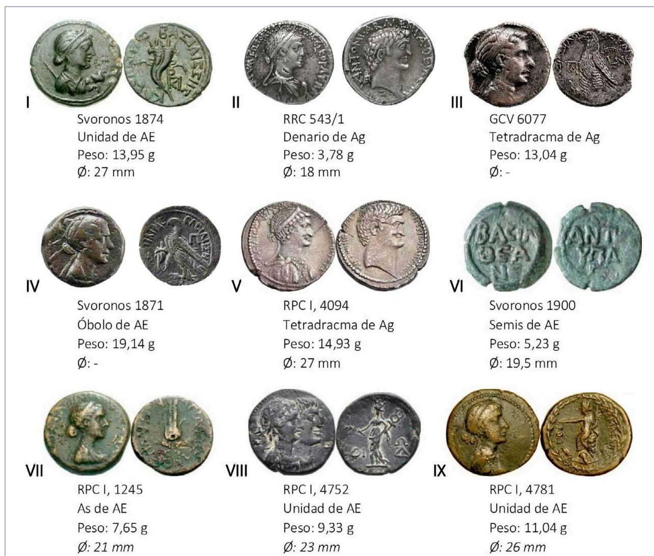
Lám. 2. Monedas donde Cleopatra es representada.

Las monedas donde Cleopatra es representada cuentan con leyendas tanto en latín como en griego. Cleopatra, por el status que alcanzó, cuenta con epítetos y renombres que serán de interés en el estudio de las leyendas. Quitando la tercera, octava y novena pieza, todas las monedas contienen alusiones directas a Cleopatra a través de la escritura (Lám. 2). Hay dos casos excepcionales: la sexta moneda donde ni siquiera hay tipos representados, pues solo contiene leyendas en anverso y reverso. El otro es un prototipo de la segunda moneda conocido como el denario bilingüe por contener leyendas en griego (anverso para Cleopatra) y latín (reverso para Antonio) (AMELA VALVERDE 2021: 167).