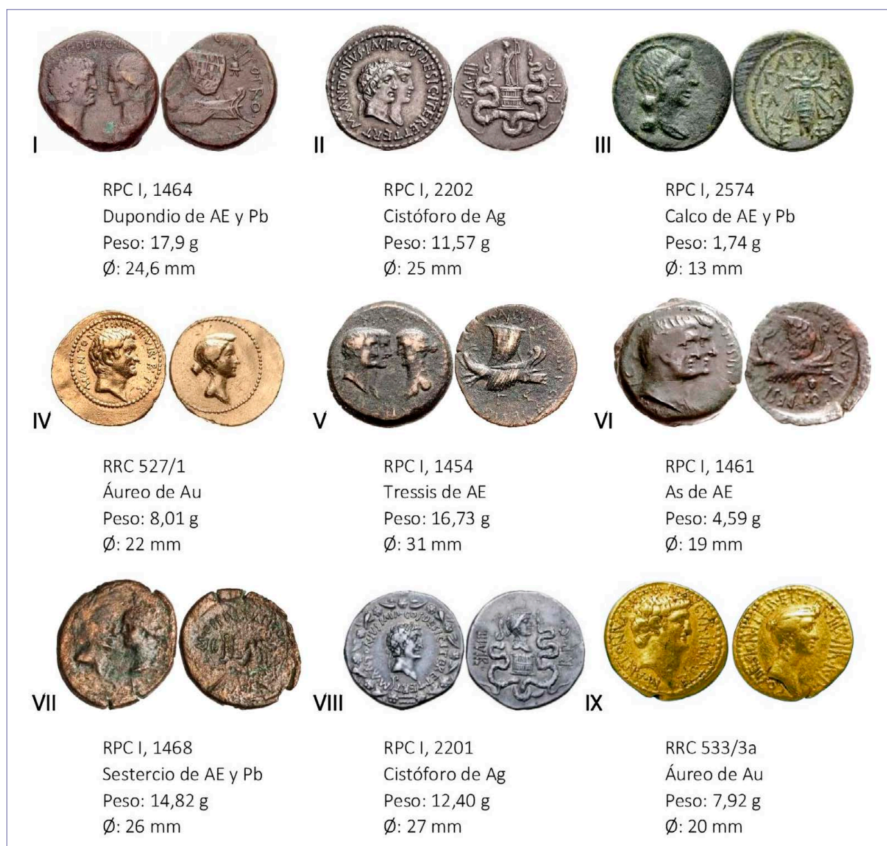
Lám. 3. Monedas donde Octavia es representada.

La presencia de Octavia, Marco Antonio e incluso Octaviano en el anverso de las monedas se acompaña con los reversos que representan galeras romanas y la alegoría mitológica a la flota de Antonio en el reverso del séptimo ejemplar (se sustituyen los barcos por una cuadriga tirada por hipocampos conducidos, probablemente por Antonio y Octavia). Estas monedas fueron acuñadas por sus prefectos de la flota y evidencian que Antonio quería que su esposa fuera considerada importante para mantener la paz. Su inclusión en la moneda se trataba de una cuestión política y estratégica, pues tanto Octaviano como Antonio necesitaban de ayuda mutua por las vicisitudes del momento y Octavia representaba ese puente de unión que mantenía a ambos unidos a pesar de que realmente se veían como competidores.