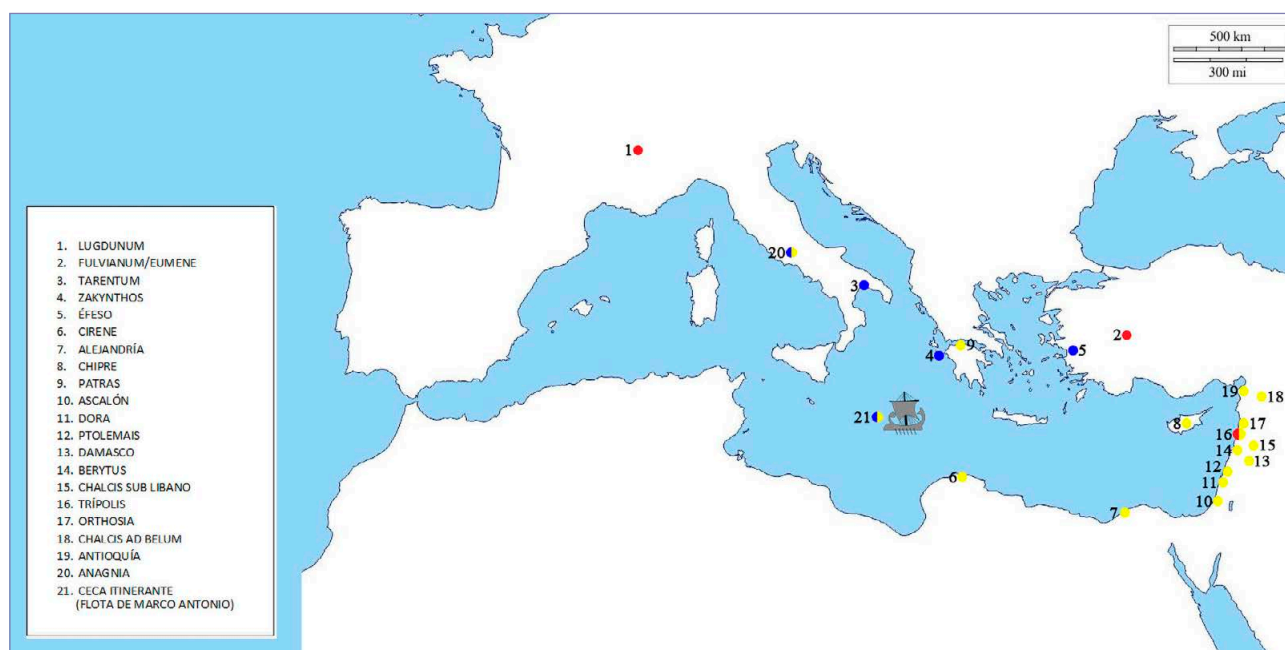
Fig. 4. Ubicación de las cecas que acuñaron monedas con alusiones a Fulvia (rojo), Octavia (azul) y Cleopatra (amarillo).

A estas hay que sumarles las cecas de Ascalón, Orthosia y Chalcis sub Libano (las tres en la zona levantina), las de Chipre, las producciones de Alejandría, Cirene y Patras, en la Grecia continental. Al igual que en las acuñaciones de la flota de Marco Antonio que comentamos en el apartado de Octavia, parece ser que había una ceca itinerante encargada de acuñaciones, seguramente para pagar a las tropas (Fig. 4). Esta también realizaría emisiones de Cleopatra junto a Antonio. Podemos destacar el caso chipriota por su relevancia para los Ptolomeos. La isla fue arrebatada por los romanos en el 59 a. C., provocando el suicido del hermano de Ptolomeo XII, Ptolomeo de Chipre. César la devolvería a Cleopatra en el 47 a. C. Las cecas de esta isla se situaban en Salamis, Kition y Paphos. Producían un elevado número de monedas de plata, pero vieron su cierre a comienzos del siglo I a. C. (BURNETT et al. , 1992: 576). En el 47 a. C., se reabría la ceca de Kition emitiendo monedas de bronce.