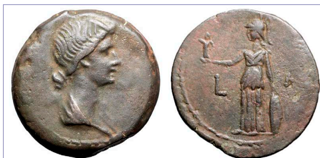
Fig. 3. Dióbolo con representación de Livia en el anverso (RPC I, 5072).

Por parte de Livia es primordial hablar de su ejercicio del patronazgo, destacándose junto a Octavia en el patrocinio de edificaciones públicas. A partir del 35 a. C., los retratos de las dos matronas comenzaron a circular por el mundo romano y alcanzaron la protección sagrada ( sacrosanctitas ), derecho solo poseído por las vírgenes Vestales y tribunos de la plebe hasta ese entonces, encumbrando a ambas a un status sagrado, implicando que sus representaciones cumplieran un rol oficial (OYA GARCÍA 2017: 325). Como esposa de Augusto, Livia llegó a tener acuñaciones en el Este, pero no en moneda oficial de Roma (KLEINER 1992: 366), destacando las acuñaciones de Alejandría (Fig. 3). Agripina la Mayor, nieta de Augusto, fue honrada post-mortem por su hijo Calígula a través de una serie de emisiones (BÉLO 2023: 91). Ella, al igual que Fulvia, fue una matrona polémica que fue odiada por Livia debido a la popularidad de la que gozó junto a su esposo Germánico. Antonia la Menor, hija de Antonio y Octavia, también fue honrada post-mortem por su hijo, el emperador Claudio, en varias acuñaciones monetarias.