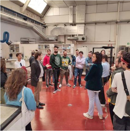
Salida de Estudio. Cartagena y su entorno. El Molinete