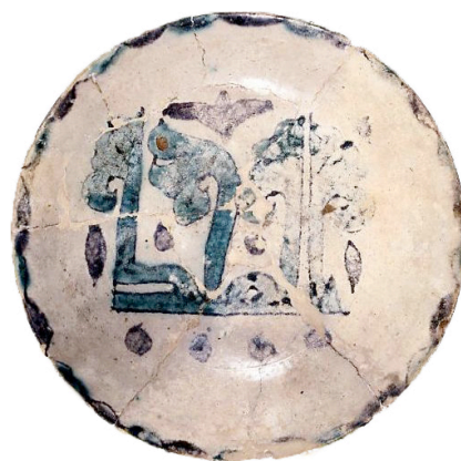
Ataifor del s. X (MAN): al-mulk (el poder)

El árabe es una lengua más necesaria de lo que a menudo se considera. Se trata de la cuarta lengua más hablada del mundo y ha sido una de las lenguas vehiculares y de cultura del Mediterráneo medieval. En lo que respecta a la Península Ibérica, fue la lengua oficial de la mayor parte del territorio durante más de seis siglos y, durante más de tres, la del territorio comprendido por el Emirato Nazarí de Granada. Por ello, cualquier historiador y arqueólogo que quiera aproximarse a la historia medieval peninsular debe verse obligado a adquirir una mínima formación en árabe clásico que le permita pronunciar los términos, nombres árabes, leer las breves inscripciones sobre cerámica y otros soportes arqueológicos e incluso poder realizar una consulta autónoma de las fuentes árabes logrando extraer de ellas informaciones claves.